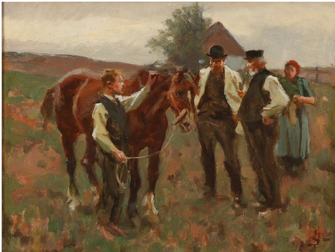
Public domain - Erik_Henningsen_- _En_Hestehandel_-_1898